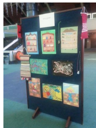
СЛ. 3. ,4. и 5. Неки од изложених радова наших ученика.

Извештај написали: Професор ТО Жељен Шимшић дипл.маш.инг Професор ТО Весна Шимшић дипл.маш.инг