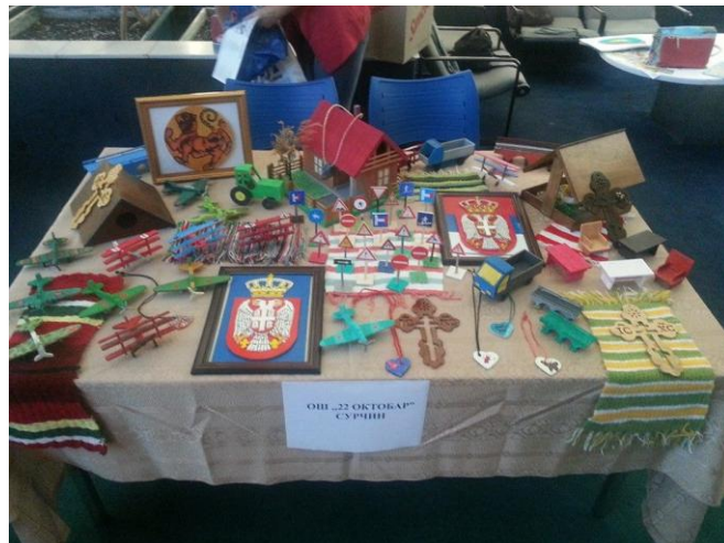
СЛ. 2. Изглед штанда ОШ „22.октобар“ Сурчин