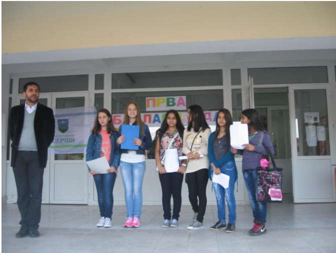
Кратак програм ученика и наставника