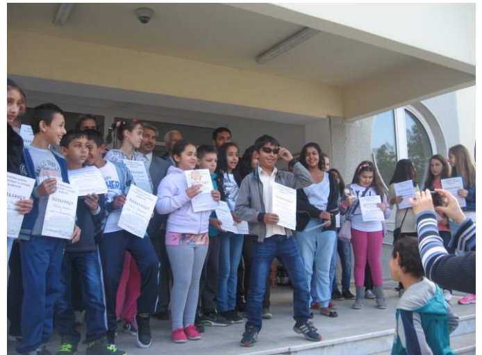
Проглашење победника и додела диплома и захвалница