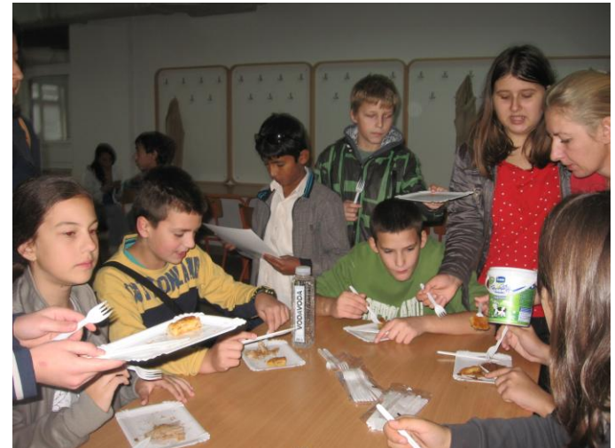
Заједничка дегустација баклава